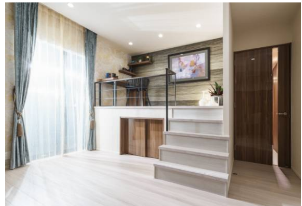
E S-Fタイプ メニュープラン3(2LDK+S)