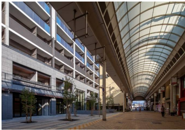
南側 タカノ橋商店街通りより